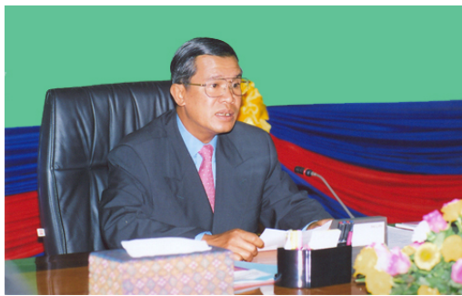
សម្តេច ហ៊ុន សែន នាយករដ្ឋមន្ត្រីនៃរាជរដ្ឋាភិបាលកម្ពុជា ដឹកនាំសម័យប្រជុំពេញអង្គគណៈរដ្ឋមន្ត្រី