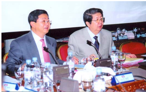
ឯកឧត្តម ឧបនាយករដ្ឋមន្ត្រី សុខ អាន កំពុងធ្វើការអធិប្បាយ ចូលកិច្ចប្រជុំពេញអង្គគណៈរដ្ឋមន្ត្រី កាលពីថ្ងៃទី ០៥-០៥-២០០៦